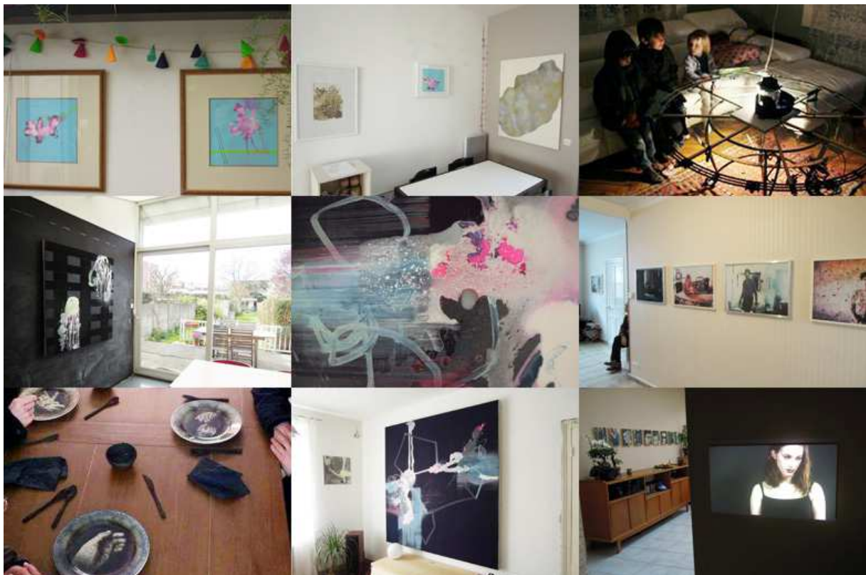
Aperçus accrochages Maisons Folles 2012