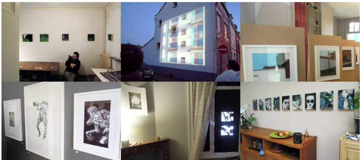
Aperçus accrochages Maisons Folles 2012